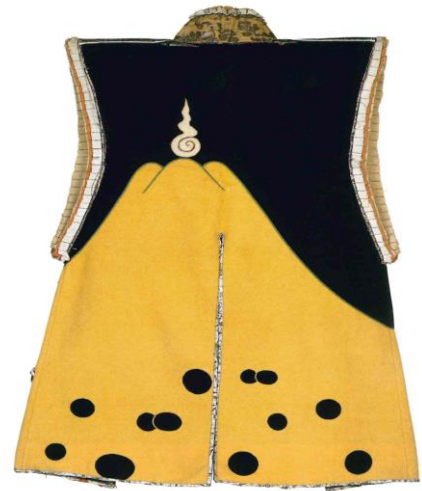
富士御神火文黒黄羅紗陣羽織