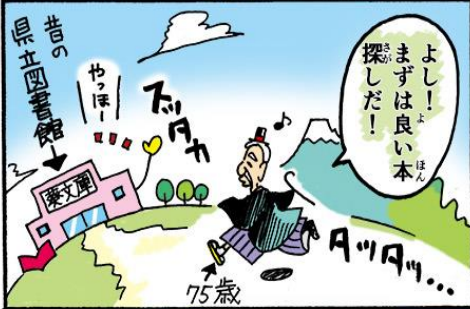
大宮町立図書館 (昭和4)