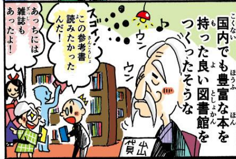
富士宮市立図書館 (昭和44)