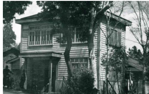
富士宮市立図書館 (昭和21) (福石神社の上)