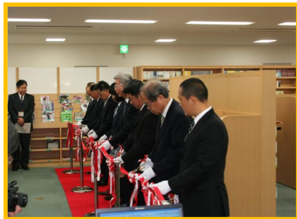
H23.3.23 開館式 ここからスタートしました。