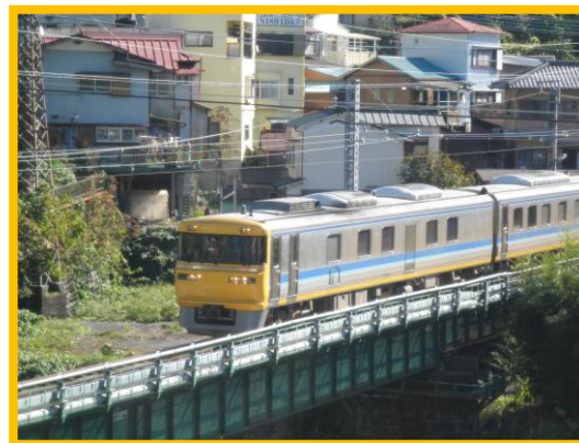
H25.11. ドクター東海撮影成功！ (2階児童書フロアより) ダイヤには公表されていないので、見ることができたらラッキーです。