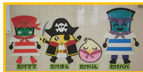
たけママ たけほん たけりん たけパパ