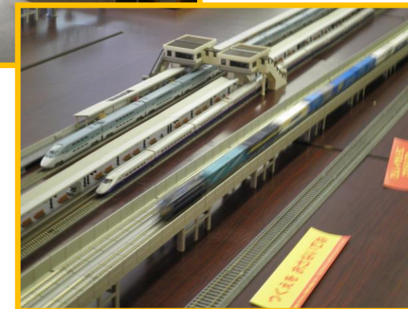
H25.8 身延線写真展&鉄道模型 富士山世界遺産登録記念として開催。 たくさんの方が来館しました。 鉄道模型は、ここから人気行事になり、年2回 (夏・春)開催しています。