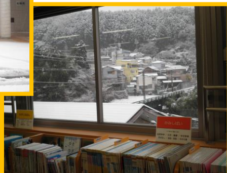
2階児童書フロア窓より