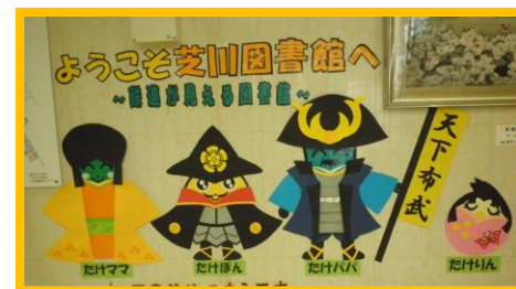
イベントごとに衣装チェンジ！ 玄関ホールでお出迎えしています。