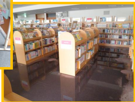
H25.10、H26.2 水害もありました。大雪の日もありました。