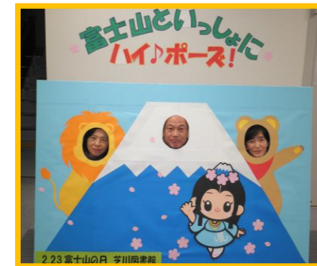
H25.2 顔パネ初登場！ 「富士山の日」に合わせて作製。 今では、年賀状の時期になると、干支に合わせて登場します。