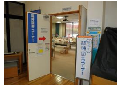
臨時図書コーナー設置