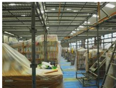
壁の奥は足場が…高天井照明のLED化