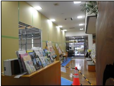
カウンター前に壁を設置。