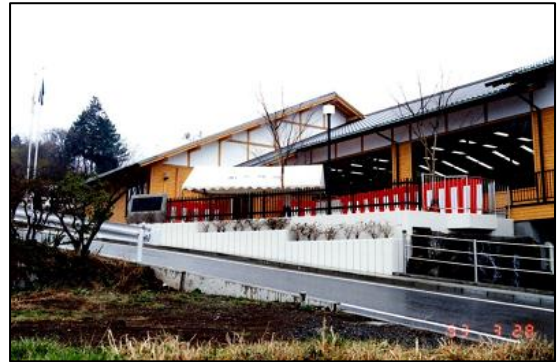
図書館南側のケヤキがまだ細くて小さいですね。