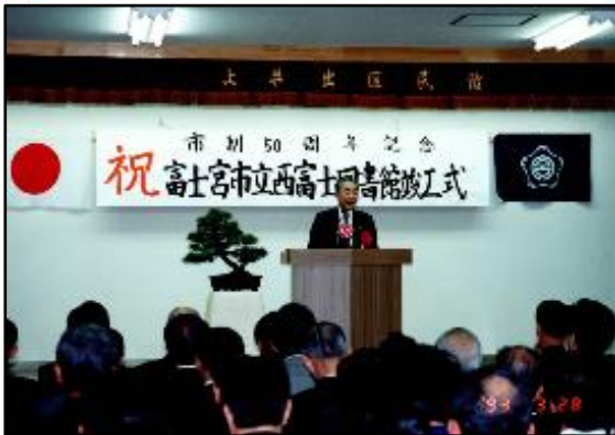
隣接する上井出区民館での竣工式